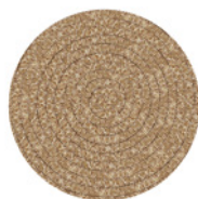
09 TRICOT TAPPETO CM Ø 400